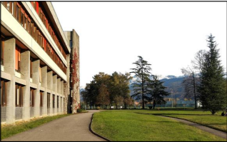
DÉTAIL 10 - GARDE CORPS K

MO : UNIVERSITÉ GRENOBLE ALPES DGD PAT - Direction de la programmation et des projets immobiliers CS 40700 - 38058 GRENOBLE cedex 9 Tel : 33 (0)4 76 51 47 07 Mail : dgdpat@univ-grenoble-alpes.fr MOE : Chabal Architectes 8 Rue Charles Testoud - 38000 Grenoble Tel : 04 76 47 00 76 Mail : chabal-architectes@chabal.fr